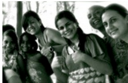
Alunos com algumas crianças da congregação