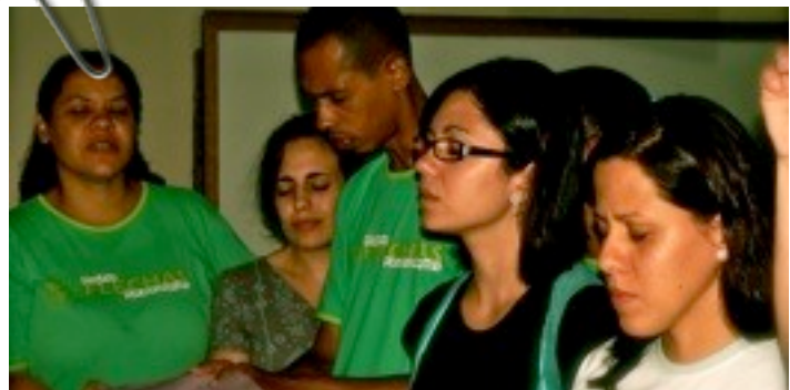
Alunos da Turma 2011 no culto de Abertura da Escola