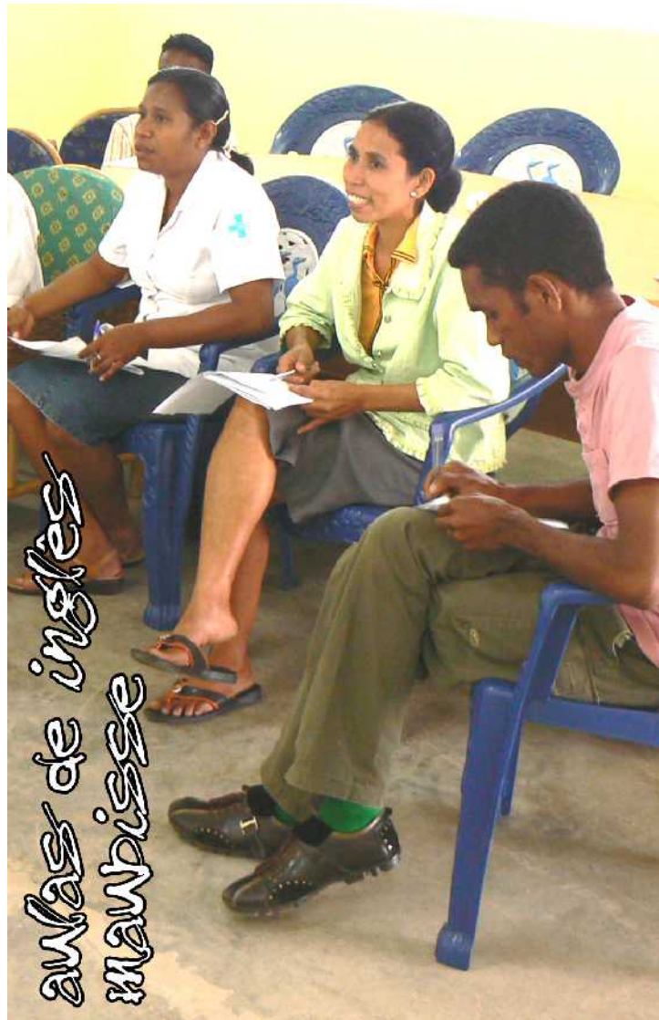
aulas de inglês maubisse

Também estive em Maubisse , uma vila nas montanhas, dando aula para a equipe do hospital local. Essas aulas foram bem diferentes, já que a maioria dos alunos tinha um nível bem básico de inglês, ao contrário do pessoal da Universidade . Tivemos apenas 4 aulas, por uma semana, mas foram bem proveitosas e, mais uma vez, pudemos estabelecer um contato muito bom ali, que pode abrir muitas portas para a TA no futuro. Além disso, pude me “expandir” um pouco mais, já que nunca havia ensinado inglês básico, fora que tive que ensinar em Tetun ;)